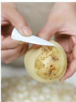
Należy zeszkrobać resztę skórki z końców.