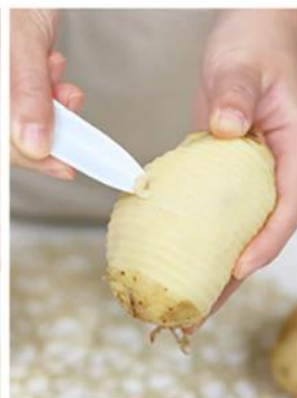
Należy usunąć pozostałe nieczystości i oczka.