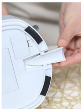
Nożyk z podstawy urządzenia

Obieraczka elektryczna nie może obrać skórki po obu końcach. Aby rozwiązać ten problem, należy użyć nożyka znajdującego się w podstawie urządzenia.